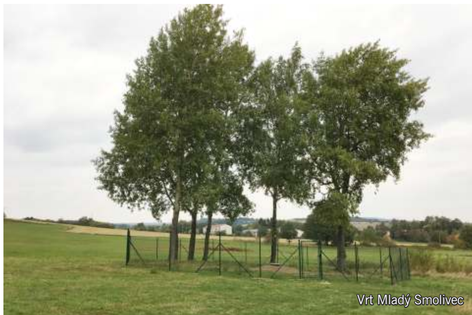
Vrt Mladý Smolivec