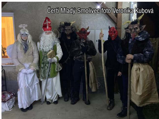
Čerti Mladý Smolivec