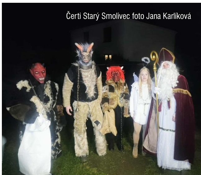
Čerti Starý Smolivec