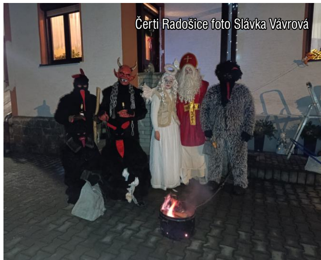
Čerti Radošice