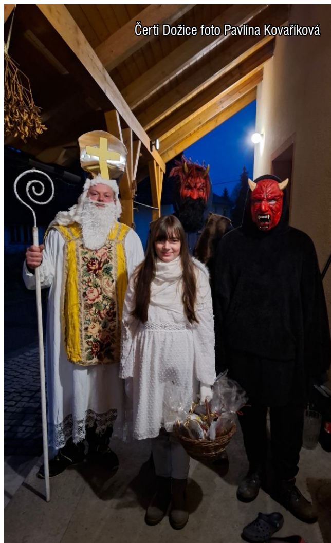
Čerti Dožice