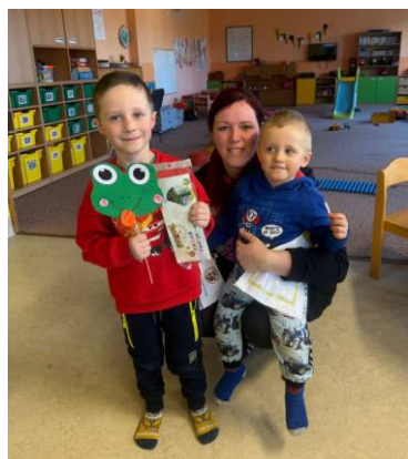
za kolektiv MŠ Kateřina Komárová

Děkujeme všem, kteří nás přišli navštívit, a těšíme se na další společná setkání.